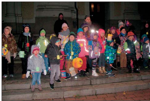
PODZIMNÍ Broučkáda v pobočkách Knihovny města Ostravy.

Ve výstavních prostorách knihovny je připravena výstava o životě a díle malíře, básníka